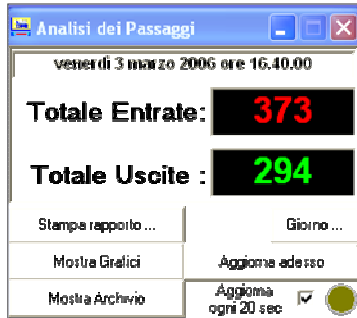
menu gestione statistiche Visualizzazione grafici stampe rapporti